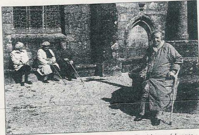
Les anciens apprécient ces moments de retrouvailles riches en échanges.

Les ateliers-mémoire, mis en place par la commune avec le soutien de l'Udarpa 29 (Union départementale des associations de retraités et personnes âgées), permettent aux anciens de Lannilis qui le souhaitent de se retrouver et de découvrir ou mieux connaître des éléments du patrimoine du canton. Une façon, pour certains, de rompre leur solitude. Ces visites réveillent en eux des souvenirs et c'est avec plaisir qu'ils les évoquent entre eux et aussi avec les personnes du CCAS qui les accompagnent et les animateurs de l'écomusée de Plouguerneau. Ils sont ainsi une quinzaine à vivre ces moments très atten-