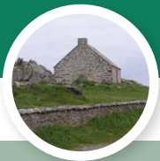
Port goémonier du Korejou

Sites animés par l'écomusée de Plouguerneau :