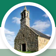
Site de Saint-Michel