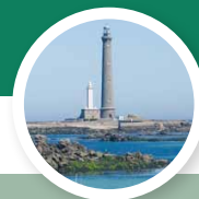
Phare de l'Île Vierge