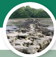
Site de Prad Paol