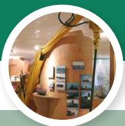
Musée des Goémoniers